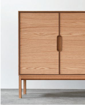
木扉×木脚タイプ (樹種：ホワイトオーク)