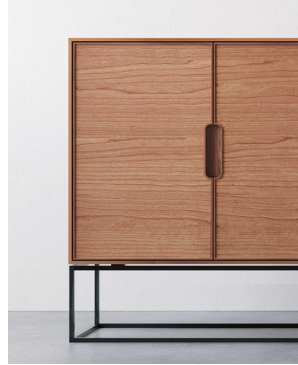
木扉×鉄脚タイプ (樹種：ブラックチェリー)