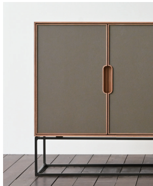
再生レザー扉×鉄脚タイプ (再生レザー：ダークグレイジュ、樹種：ホワイトオーク)