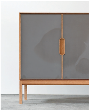
鉄扉×木脚タイプ (樹種：ホワイトオーク)