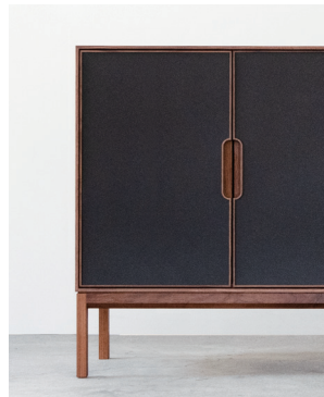
再生レザー扉×木脚タイプ (再生レザー：ブラック、樹種：ウォールナット)

脚部は木脚と鉄脚の2タイプ。 扉・抽斗の面材は6タイプ。3樹種から選べる木扉、黒皮鉄板をイメージして薄い銅板に特殊塗装を施した鉄扉、再生レザー（皮革繊維再生複合材）は、ブラックとダークグレイジュの2色をラインナップ。 多彩な組み合わせをお楽しみ下さい。