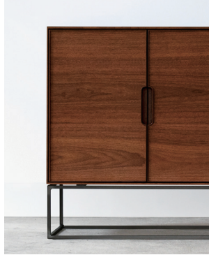
木扉×鉄脚タイプ (樹種：ウォールナット)