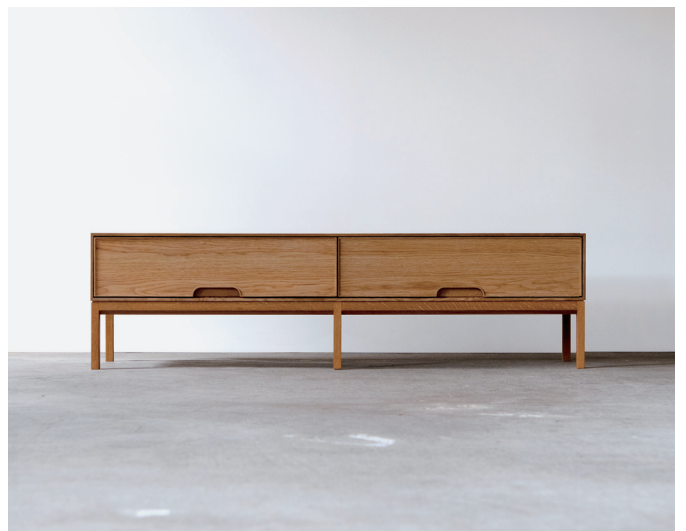
TV board 1600 木扉×木脚タイプ (樹種：ホワイトオーク)