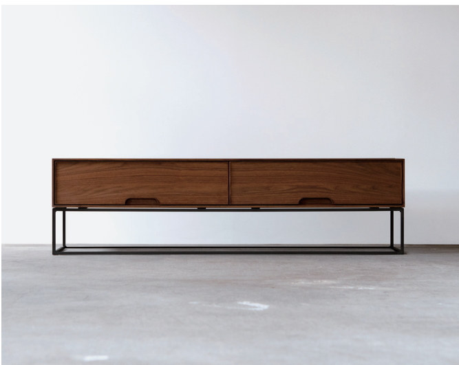
TV board 1600 木扉×鉄脚タイプ (樹種：ウォールナット)

※写真はラフ リビングキャビネットです。 ※鉄面材の仕上げの色味や表情のムラには個体差がございます。あらかじめご了承ください。